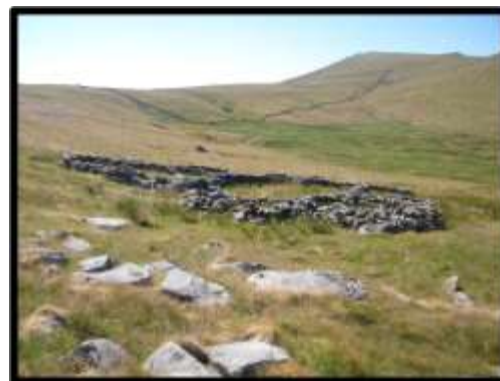
Cors y Ddalfa

9.1.2 Mae olion preswyliaeth pobol yn rhan annatod o dirlun Llŷn ac wedi dylanwadu llawer ar sut mae'r ardal yn edrych erbyn heddiw. Dros y canrifoedd mae gwahanol genedlaethau a charfannau o bobol wedi dylanwadu ar y tirlun i greu amgylchedd hanesyddol gymhleth a diddorol, gyda chymeriad a naws arbennig.