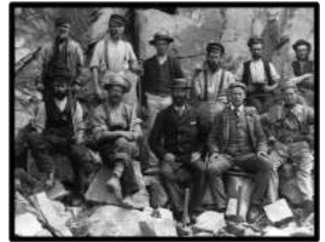
Gweithwyr yn Chwarel Cae'r Nant