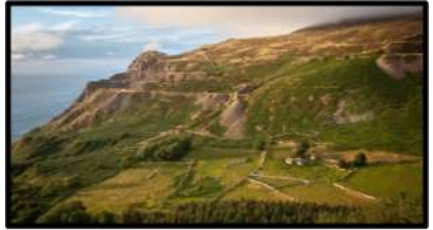
Chwarel Cae'r Nant

heddiw. Y prif chwareli oedd Trefor, Nant Gwrtheyrn / Carreg y Llam a'r Gwylwyr yn Nefyn. Roedd llawer o fân chwareli hefyd fel ar Fynydd Tir y Cwmwd, Gyrn Ddu a Thrwyn Dwmi. Mae'r chwareli wedi gadael eu hoel ar yr ardal ond hefyd maent wedi bod yn gyfrifol am ddatblygu tai yn gartrefi i'r gweithwyr ac mewn rhai mannau pentrefi cyfan fel Pistyll, Trefor a Nant Gwrtheyrn.