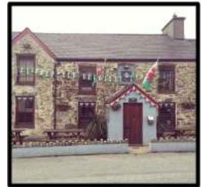
Tafarn y Fic, Llithfaen

12.6.2 Mae hunangyflogaeth yn uchel yn yr ardal fel mae Adroddiad o Gyflwr yr AHNE (2014) yn ei gadarnhau. Mae'r sector yma yn cynnwys amaethwyr, contractwyr unigol, adeiladwyr a plymwr, trydanwyr, seiri coed ayb. Eto mae'r bobol hyn yn darparu gwasanaeth i'r gymdeithas leol a rhai sydd yn berchen ar eiddo yn yr ardal yn ogystal â chynnal a chadw eiddo a thiroedd – yn cynnwys rhai adeiladau a strwythurau hanesyddol, cloddiau, waliau, llwybrau cefn gwlad ayb.