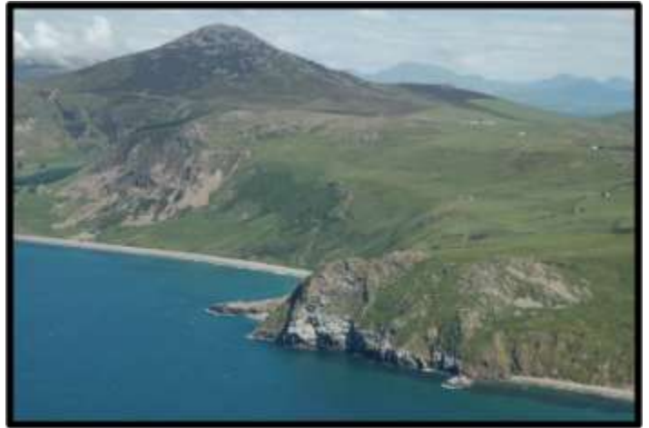
Yr Eifl a Charreg y Llam

8.2.3 Gwelir dadansoddiad manwl o'r holl gynefinoedd perthnasol i Llŷn yn Natur Gwynedd. Manylir ar hyn drwy nodi beth yw arwynebedd y cynefinoedd pwysicaf (blaenoriaeth Cymru/ Y DU). Mae'r rhan fwyaf o'r cynefinoedd yn Llŷn wedi eu cynnwys fel cynefinoedd sy'n flaenoriaeth o ran gwarchod amrywiaeth biolegol yng Nghymru yn Adran 42, Deddf Amgylchedd Naturiol a Chymunedau Gwledig 2006. Manylir ar y cynefinoedd pwysicaf yn yr ardal isod: