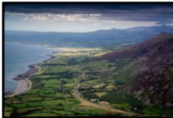
A499 rhwng Aberdesach a Llanaelhaearn