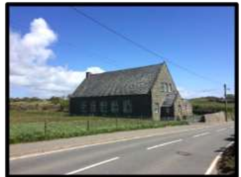
Neuadd Bentref Mynytho

11.6.1 Mae cyfleusterau a gwasanaethau digonol yn bwysig ar gyfer meithrin cymdeithas ac ar gyfer cynnal cyfalaf cymdeithasol. Ar hyn o bryd mae darpariaeth dda o gyfleusterau cymunedol traddodiadol megis neuaddau pentref ac adeiladau at ddefnydd cyhoeddus (e.e. adeiladau crefyddol) yn yr ardal. Mae rhain yn bwysig ar gyfer cynnal gweithgareddau megis cyfarfodydd, cynnal cyrsiau hyfforddiant, adloniant, digwyddiadau codi arian ac yn y blaen.