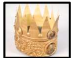
Coron Brenin Enlli