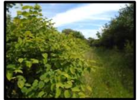
Canglwm Siapaneaidd ym Mryncroes

8.21.5 Mae gan dir-feddianwyr, rheolwyr tir Cyngor Gwynedd, Cyfoeth Naturiol Cymru a'r Gwasanaeth AHNE rôl i'w chwarae mewn monitro a rheoli rhywogaethau ymledol, yn enwedig rhai estron, yn yr ardal.