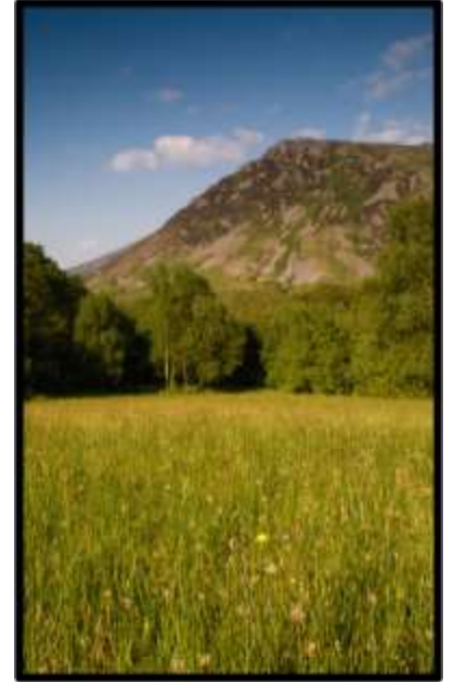
Coed Eiernion, Trefor