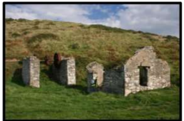
Nant y Gadwen

9.5.4 Daethpwyd yn ymwybodol fod manganis yn ardal Rhiw yn 1840 a dechreuwyd ar y gwaith o'i gloddio, ar raddfa fechan, yn 1858. Roedd dwy safle benodol sef Benallt a Nant y Gadwen a bu cyfnodau o brysurddeb a chyfnodau tawlech o ran cloddio a chyflogaeth. Bu gweithio prysur yn Rhiw yn ystod y ddau Ryfel Byd oherwydd roedd galw am y manganis i wneud haearn yn fwy gwydn. Yn Ysgo fe welir olion y cyfarpar a ddefnyddid i gario'r deunydd at y môr hyd heddiw. Daeth y gwaith i ben yn y 1940au ac nid oes unrhyw waith cloddio mwynau bellach yn Llŷn.