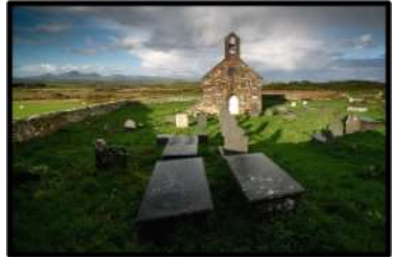
Eglwys Llanfihangel Bachellaeth

9.1.8 Mae llawer o adeiladau hanesyddol – fel y ffermdai, adeiladau amaethyddol, eglwysi a chapeli yn parhau i gael eu defnyddio er mae rhai yn segur ac yn dadfeilio. Mae'n bwysig anelu i gynnal a chadw adeiladau hanesyddol a chynnal eu cymeriad arbennig – boed yn adeiladau unigol neu glwstwr o adeiladau fel canol pentrefi.